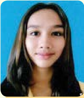
แคทเธอริน เซอร์แรท