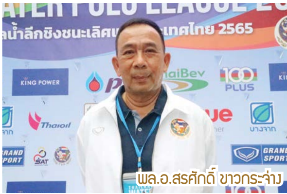
พล.อ.สรศักดิ์ ขาวกระจ่าง

พล.อ.สรศักดิ์ ขาวกระจ่าง ประธานฝ่ายกีฬาโปโลน้ำ กล่าวว่า ผลงานครึ่งปีแรกฝ่ายกีฬาโปโลน้ำได้เน้นหนักไปกับการป้องกันแชมป์ซีเกมส์ของทีมโปโลน้ำหญิงและเร่งพัฒนาทีมโปโลน้ำชายให้ติดอันดับ มีนักกีฬาใหม่เข้ามาร่วมทีมเพิ่มเติมทั้งนักกีฬาระดับเยาวชนและนักกีฬาทีมชาติ โดยนักกีฬาใหม่มาจากศูนย์ฝึกกีฬาโปโลน้ำของสมาคมฯ ได้แก่ เชียงใหม่ นครราชสีมา และสงขลา ซึ่งเป็นแหล่งผลิตนักกีฬาเพื่อส่งต่อมาเก็บตัวฝึกซ้อมเตรียมคัดเลือกเป็นตัวแทนทีมชาติต่อไป โดยได้พยายาม Set Up ทีมเพื่อให้ได้นักกีฬารุ่นใหม่มาพัฒนาและส่งแข่งขันในต่างประเทศ โดยคาดหวังว่านักกีฬารุ่นใหม่จะอยู่เป็นกำลังสำคัญได้ระยะยาว และทดแทนนักกีฬาเก่าที่ต้องออกจากทีมเพื่อไปศึกษาต่อหรือไปทำงาน