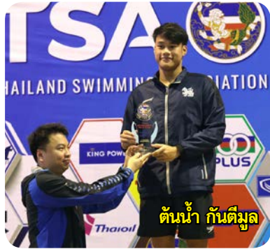
ต้นน้ำ กันตีมูล