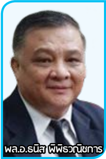
พล.อ.อนิส พิภพวิชากร

วารสารเอควอเตอร์ฉบับแรกของปี พ.ศ.2566 ประจำเดือน มกราคม - มิถุนายน ได้มีการปรับโฉมใหม่ มีจำนวนหน้าเพิ่มขึ้น ลดจำนวนการพิมพ์เหลือเพียงปีละ 2 ฉบับ แต่เนื้อหายังเข้มข้นเหมือนเดิม เป็นการรวบรวมผลงานของสมาคมนักว่ายน้ำแห่งประเทศไทยในรอบ 6 เดือน มานำเสนอ พร้อมกับแนวทางและแผนงานในอีก 6 เดือนข้างหน้า