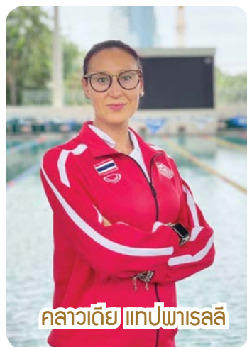
คราวเดีย แอปพารลลี